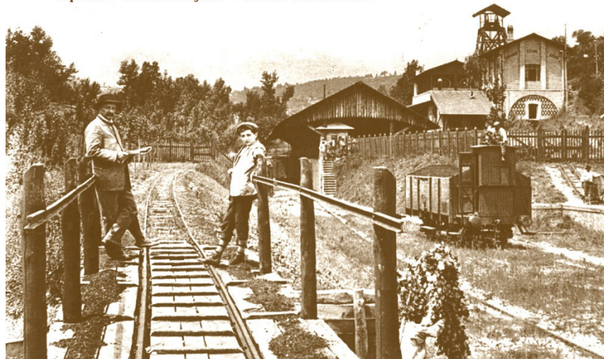
Spoleto - Miniera Morgnano - Cantiere Rosina Breda

info@lst-spoletto.it info@amicidelleminiere.it