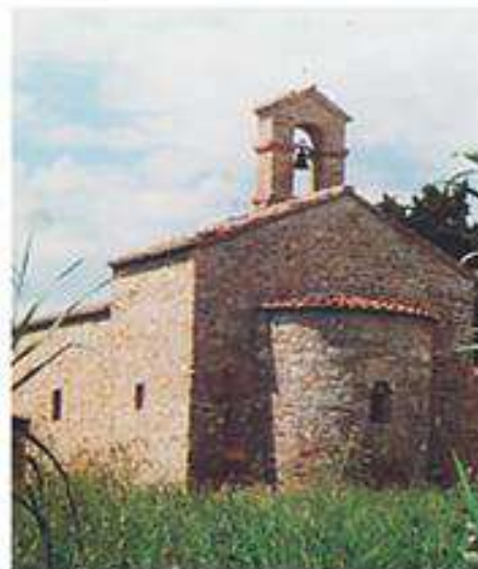
Pieve di S. Maria in Ripa sec. X - XI