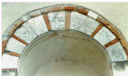
Portale della Pieve di S. Maria in Ripa al centro dell'arco la Croce Patente dei Templari