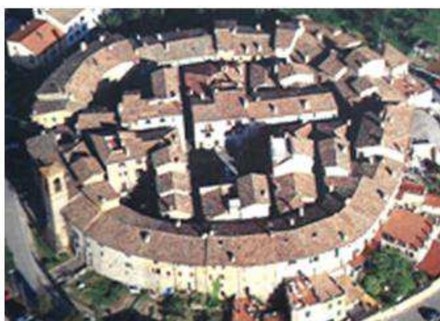
Castello di Ripa eretto nel 1266 fortificazione di poggio a schema circolare