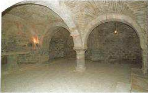
Cripta di S. Giustino d'Arna sec. XI