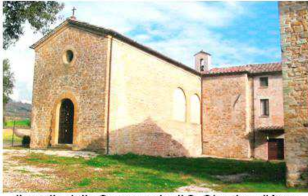
il cortile della Commenda di S. Giustino d'Arna