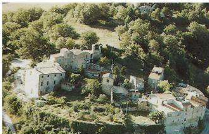
il castello di Castel d'Arno