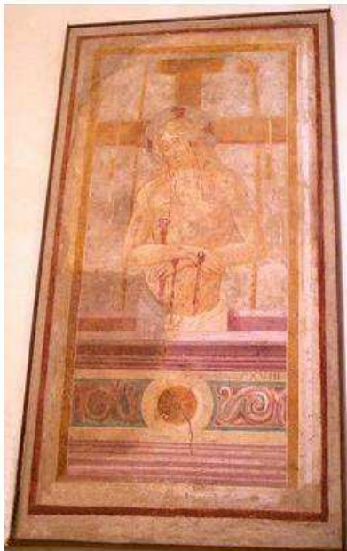
Chiesa Madonna della Grazie di Fratticiola sec. XIV con affreschi attributi alla scuola del Perugino