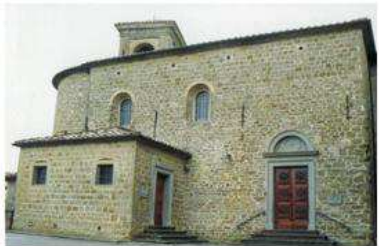
Chiesa di S. Pietro a Fratticiola sec. XIII, sulla lunetta del portale la Croce dei Cavalieri di Malta