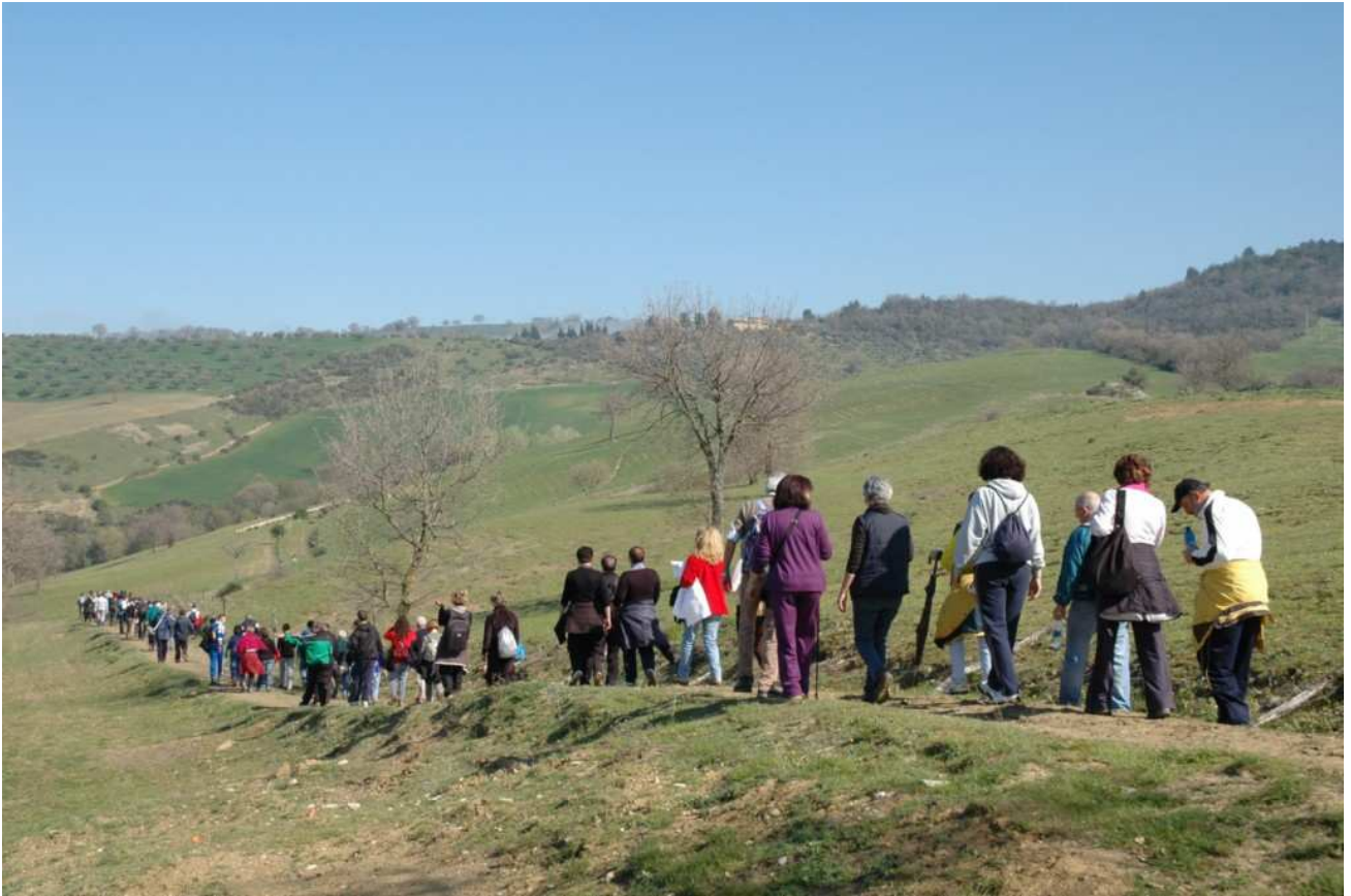
Pianello – Pg – Le terre dell'Alfani - la camminata di "Attravers...Arna & Sentieri Aperti" (18 – 04 – 2010)