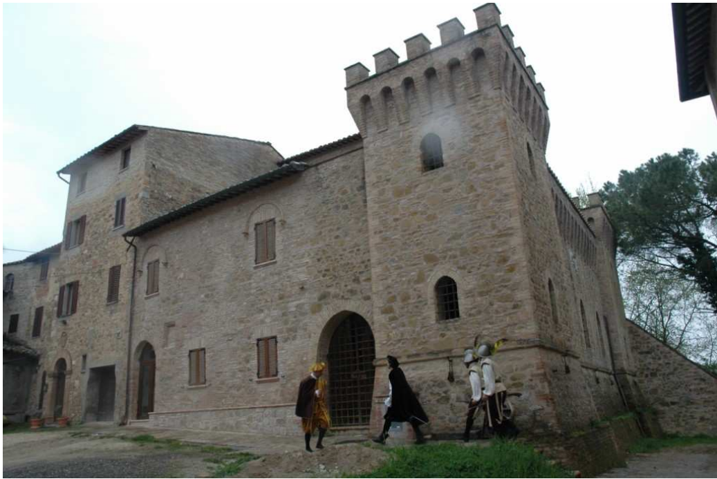
Civitella d'Arna : "percorrendo le terre dell'Alfani" la camminata teatralizzata di "Attravers...Arna & Sentieri Aperti" (11 - 04 - 2010)