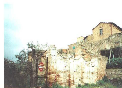
il muro di cinta del "malgamato" giardino degli Alfani