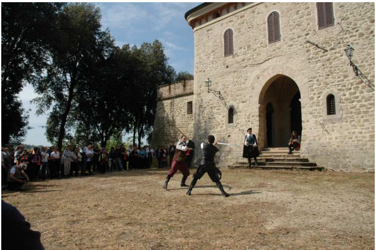
Montecapanno - PG : "percorrendo le terre dell'Alfani" la camminata teatralizzata di "Attravers...Arna & Sentieri Aperti" (11 - 04 - 2010)