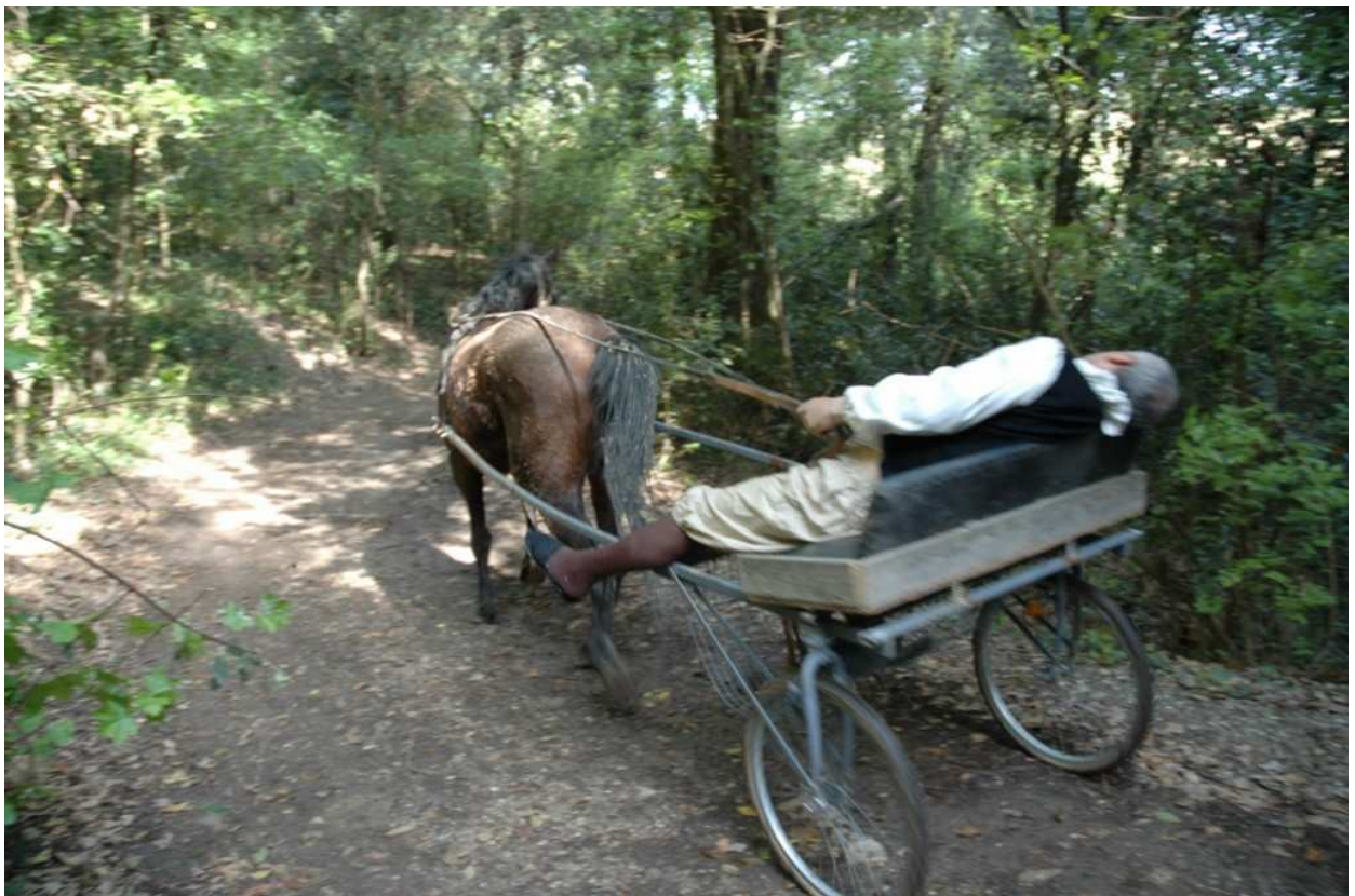
Ripa – Pg – Le terre dell'Alfani La camminata teatralizzata di "Attravers...Arna & Sentieri Aperti" (25 – 04 – 2010)