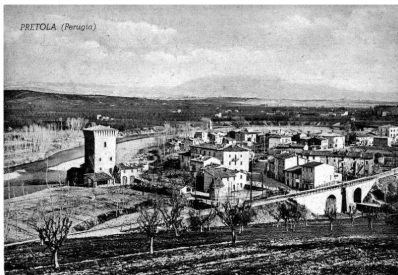
Pretola (Pg) - anni '40 – Panorama con "aceri campestri" ( stucchi )

Per la raccolta della legna veniva, e ancor'oggi viene utilizzata l' Uncinaia , uno strumento di legno simile ad un'ancora, che si ricavava dall'acero campestre ( stucchio ), la pianta che sosteneva la vite (c.d. vite maritata), molto diffusa nelle colline umbre di quegli anni.