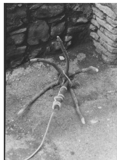
"l'uncinaia" di "acero campestre" ( stucchio )