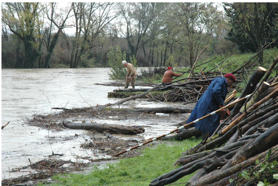
Pretola – PG_ "Raccoglitori di legna" durante una delle piene del Tevere