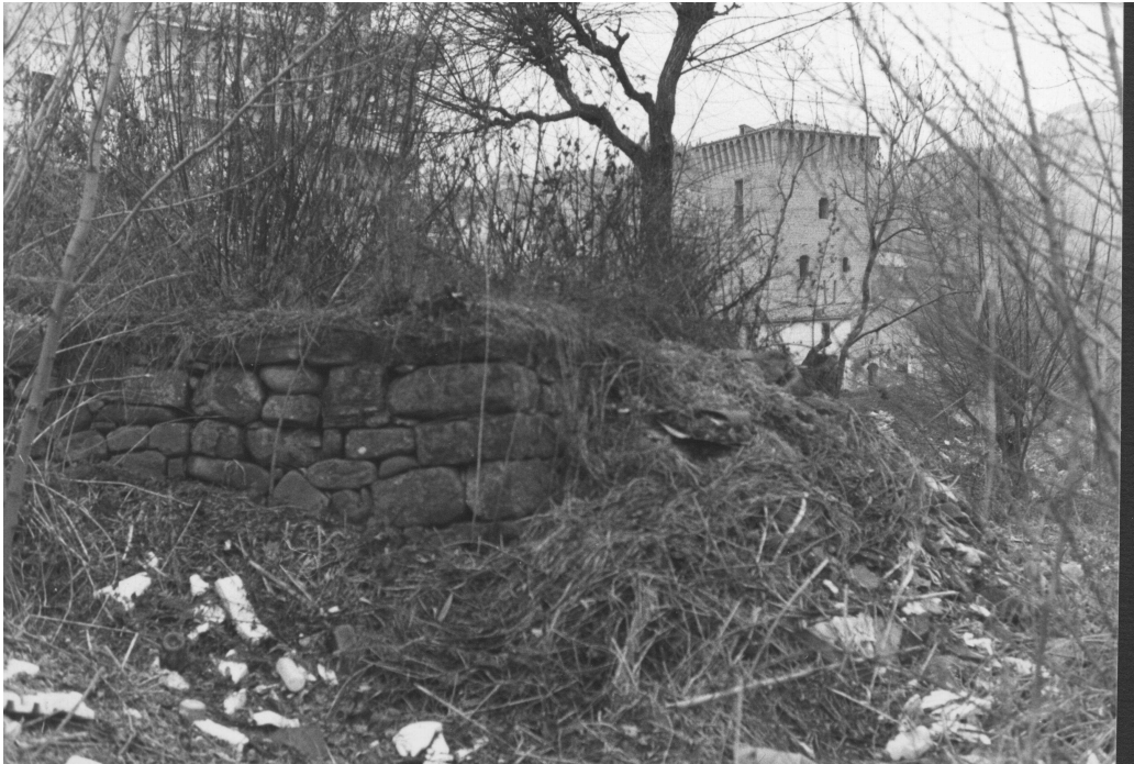
Pretola ( PG) Quel che rimaneva dei "pòsti" negli anni '70