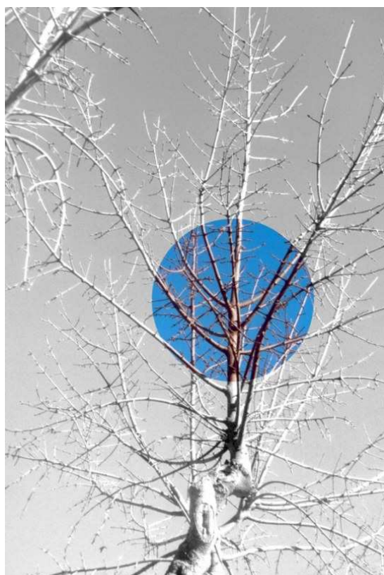
La parte di acero necessario per costruire l'Uncinaia