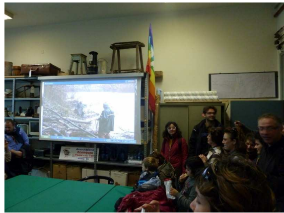
Pretola - Centro di Documentazione proiezione video