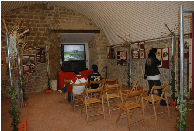
Mostra 'L'Uncinaia e la sua Storia' (Ottobre 2006) presso la Torre Medievale di Pretola (PG).