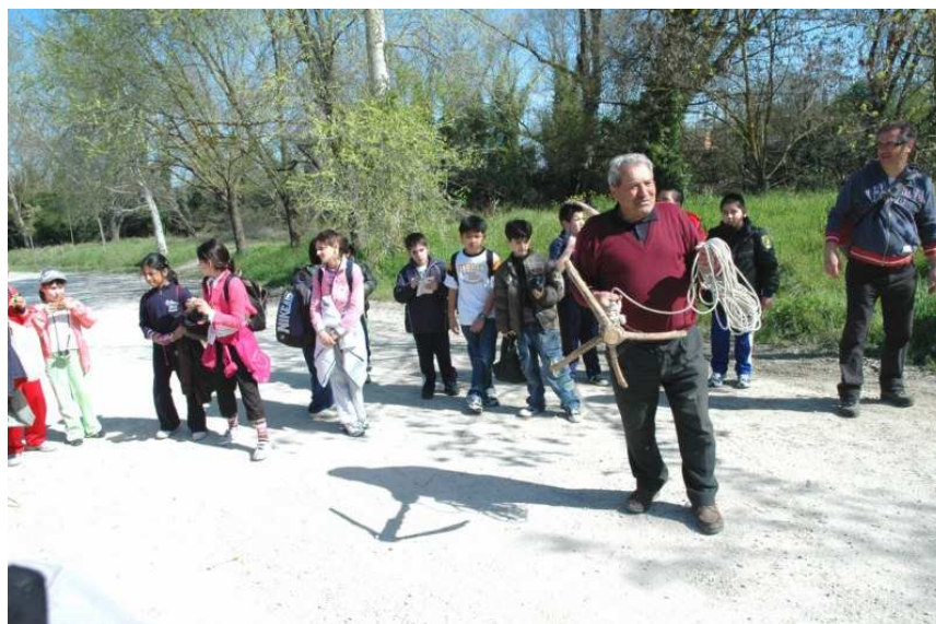
Pretola - Incontro della scuola con il raccoglitore di legna