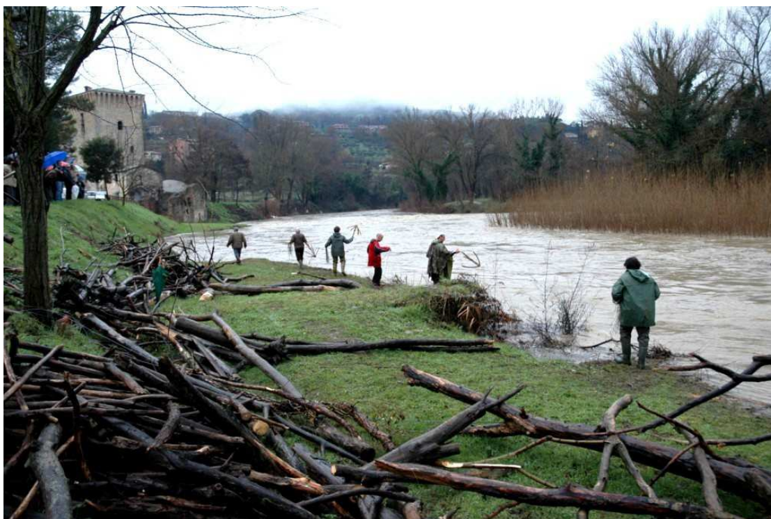
Pretola – PG_ " Raccoglitori di legna" durante una delle piene del Tevere