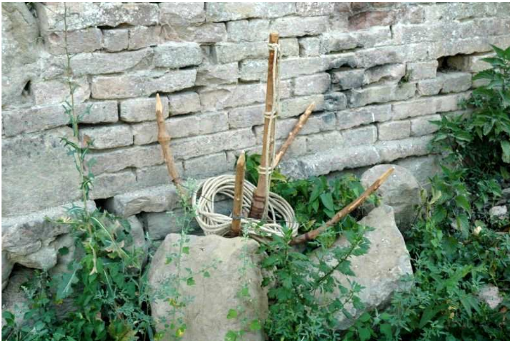
L’Uncinaia ( l’Uncinèa ) di acero campestre

L’uncinaia era, ed è uno strumento di legno (in genere di Acero campestre) che serve per raccogliere la legna che il fiume Tevere trasporta durante le piene, la sua forma è simile a quella di un’ancora, con quattro uncini ed un asse centrale a cui è legata una fune (lima), utilizzata per il lancio ed il recupero dell’uncinaia.