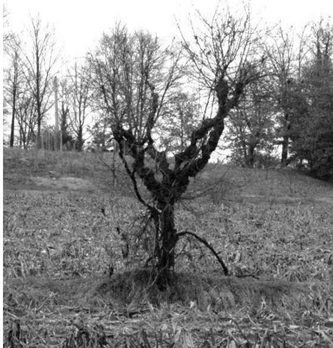
L'acero campestre ( stucchio )

Oggi, in terreni marginali non più coltivati, si può ancora vedere qualche raro esemplare di acero campestre.